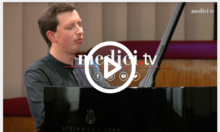
Franz Liszt: Années de pèlerinage, première année – Suisse, S160